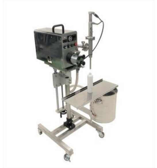
オプション充填機①